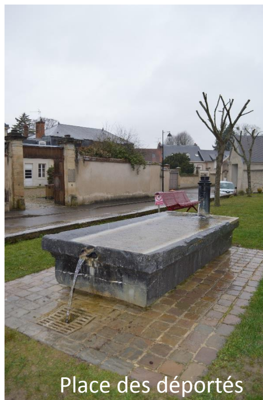
Place des déportés