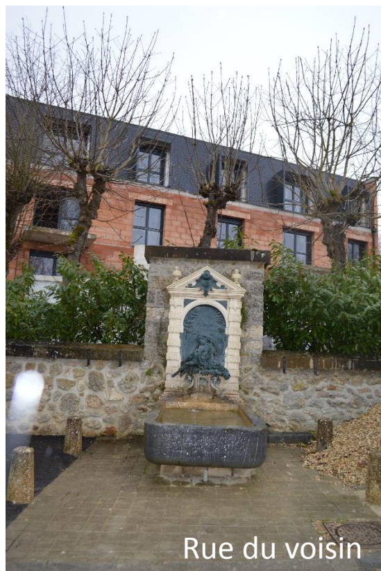
Rue du voisin