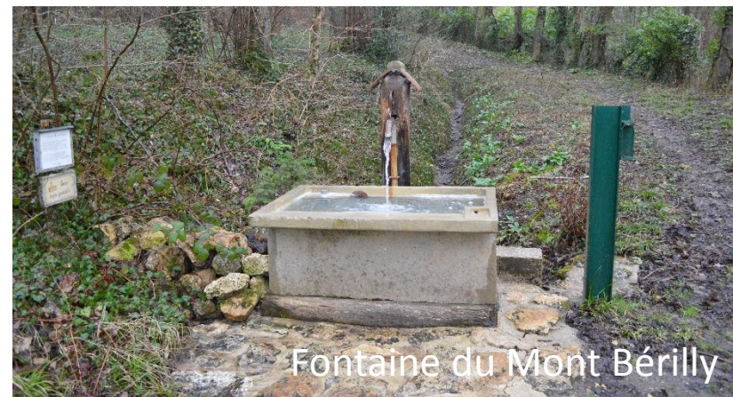
Fontaine du Mont Bérilly