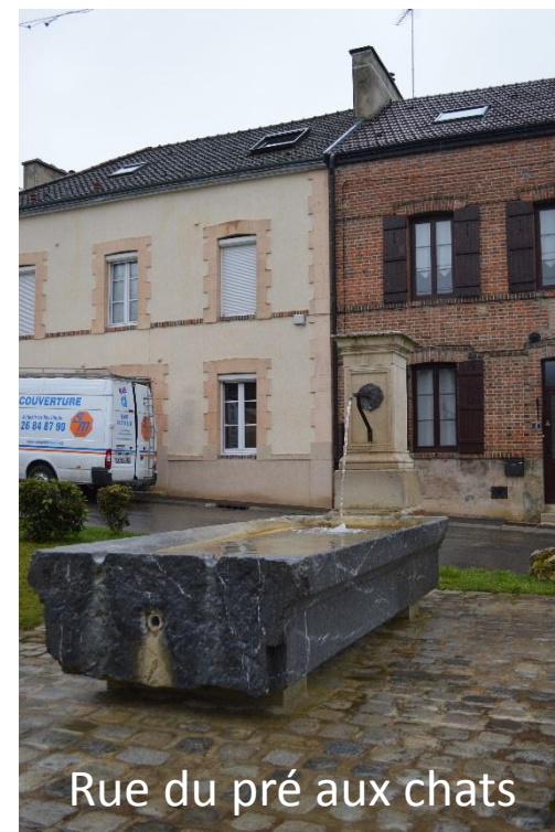
Rue du pré aux chats