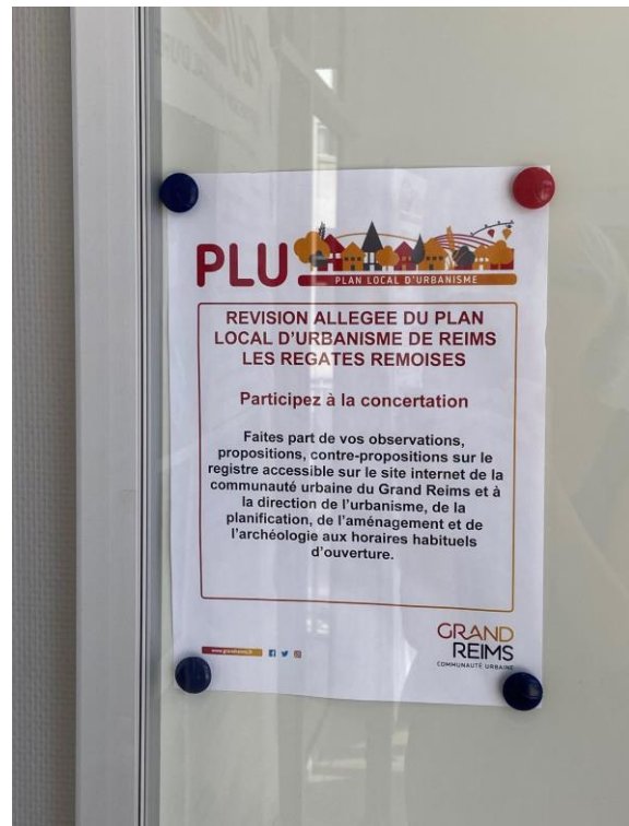
Extrait de l'affichage réalisé au siège de la CUGR