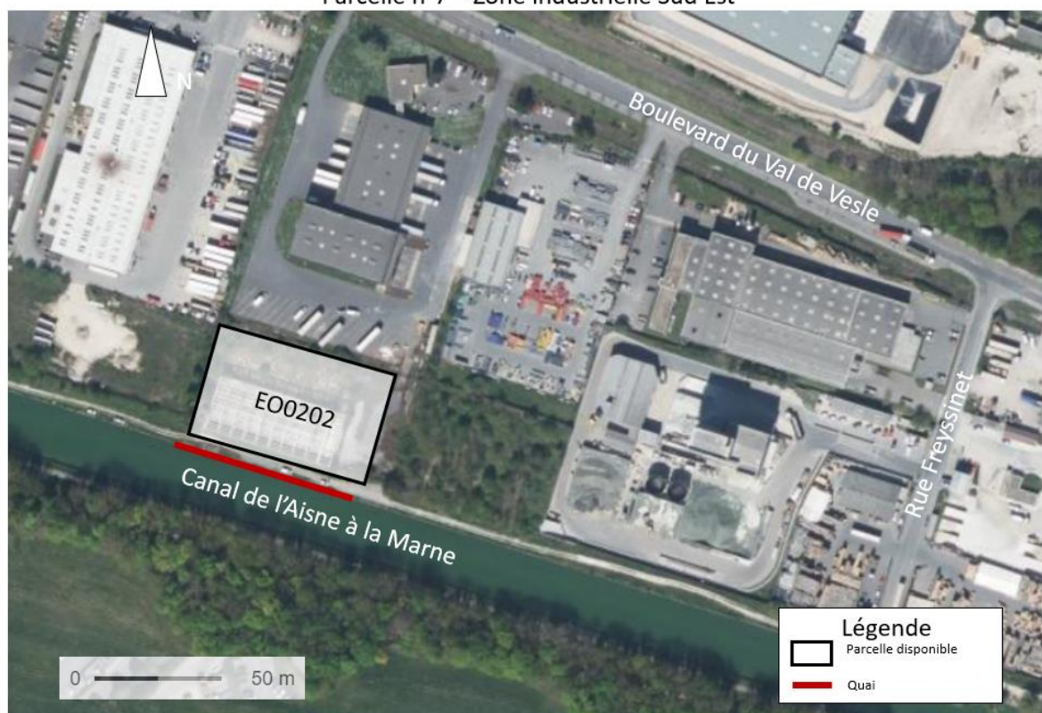
Parcelle n°7 – Zone industrielle Sud Est