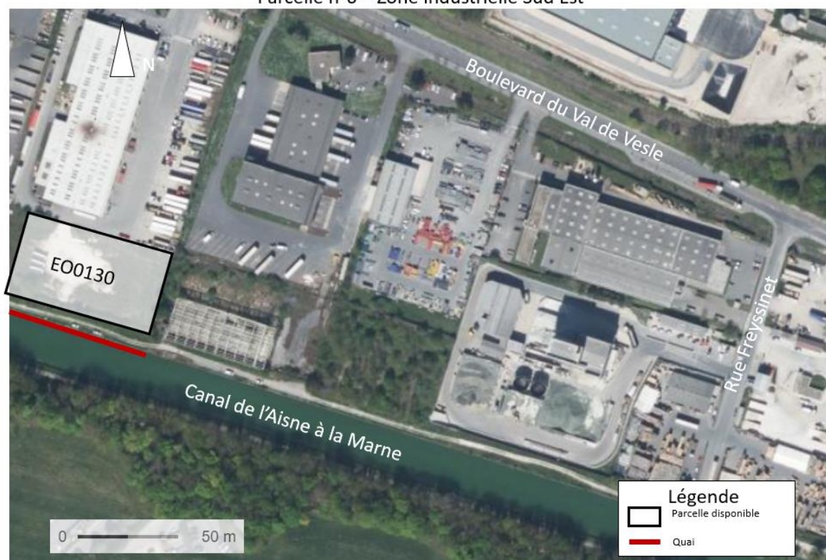
Parcelle n°6 – Zone industrielle Sud Est