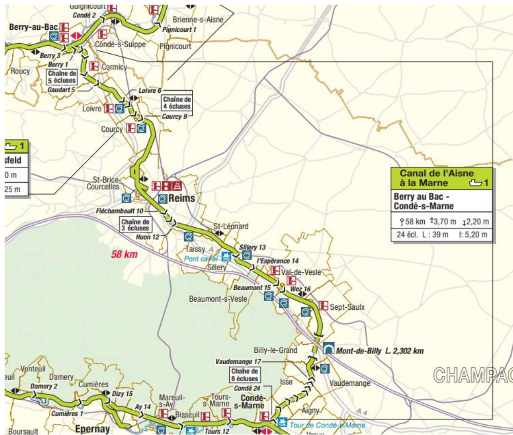
Le canal de l'Aisne à la Marne (carte VNF)

Reims. Cette zone géographique est traversée par le canal de l'Aisne à la Marne (CAM) de gabarit CEMT 1 au mouillage de 2,2m sur le chenal de navigation. Les bateaux admis sur ce réseau sont les Freycinets avec une capacité d'emport oscillant entre 200 et 300t (l'équivalent de 10 à 15 camions de 44t). Les horaires d'écluses sont les suivantes : 7h-19h. Pour plus d'informations sur cet itinéraire nous vous invitons à consulter le règlement particulier de police (RPP) n°8 liaison Marne-Escaut : RPP n°8 - Liaison Marne-Escaut - version officielle (vnf.fr) et l'Avis à Batellerie n°1 : Avis à la batellerie n°1 du Bassin de la Seine - VNF