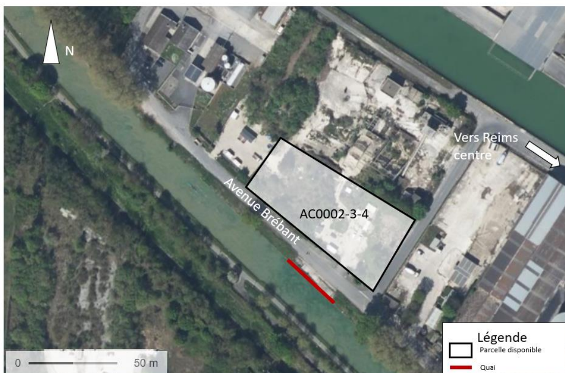
Parcelle n°3 – Port Colbert