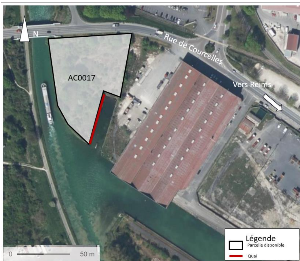
Parcelle n°4 – Port Colbert